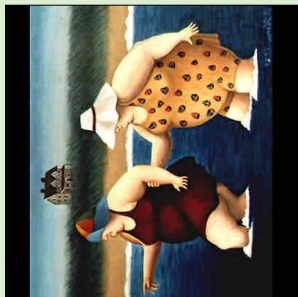
Liv i havnen!