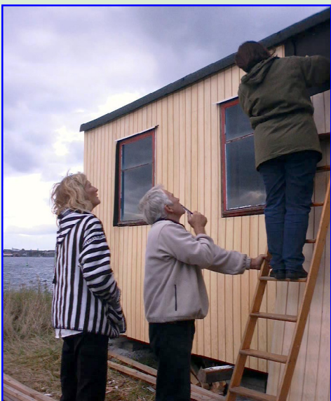
Vi arbejder også „praktisk“

Østerbro Havnekomité arbejder for at inddrage især østerbroerne i en debat om havneplanlægningen i Nordhavnsområdet.